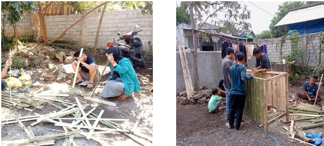
Gambar 2. Pelaksanaan Kegiatan Pengabdian Melalui Pelatihan Pembuatan Bak Sampah Berbahan Dasar Bambu

Kondisi yang diharapkan yaitu agar masyarakat di desa Aikprapa ini bisa menyadari akan pentingnya menjaga lingkungan dan hidup sehat, karena rata-rata masyarakat di desa Aikprapa ini masih sering membuang sampah sembarangan, sehingga masalah sampah ini menjadi permasalahan besar yang ada di desa Aikprapa. Oleh karenanya penulis sebagai utusan peserta KKP-DR UIN Mataram membuat sebuah program untuk mengatasi permasalahan sampah ini dengan mengajak masyarakat setempat untuk gotong royong membersihkan lingkungan yang ada disekitarnya. Selain itu, penulis beserta rekan-rekan KKP-DR UIN Mataram Desa Aikprapa membuat tong sampah besar yang terbuat dari bambu dan akan diletakkan di beberapa titik (dusun) yang ada di desa Aikprapa. Kemudian sampah yang sudah terkumpul tersebut akan di pilah pilah mana yang termasuk sampah organik dan anorganik. Program ini tentunya akan berjalan dengan lancar dengan adanya partisipasi dari pihak kepala desa Aikprapa, kadus-kadus, para pemuda dan seluruh masyarakat yang ada di desa Aikprapa. Dengan dilaksanakannya program ini diharapkan dapat merubah kebiasaan masyarakat yang sering membuang sampah sembarangan agar tidak membuang sampah lagi secara sembarangan dan dapat memilah sampah organik dan anorganik agar dapat di daur ulang dan menciptakan nilai lebih dari barang-barang bekas tersebut, sehingga lingkungan yang ada di desa Aikprapa ini menjadi bersih, sehat dan tentunya terhindar dari segala macam penyakit.