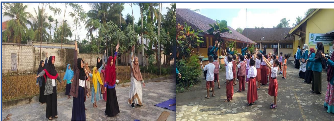
Gambar 5: Senam sehat

Kegiatan senam sehat dilakukan empat kali dalam seminggu. Yakni dari hari senin sampai dengan hari kamis. Kegiatan senam sehat ini dilakukan dengan tetap mentaati protocol kesehatan. Senam sehat dilakukan dengan sasaran yaitu masyarakat dan adik-adik Dusun Bangket Gawah yang bertujuan untuk meningkatkan kebugaran jasmani masyarakat serta adik-adik Bangket Gawah mengingat sekarang masa pandemic covid-19 jadi perlu melakukan olahraga salahsatunya yaitu kegiatan senam ini. Harapan dari adanya senam ini semoga menjadi kebiasaan yang baik bagi masyarakat untuk tetap menjaga kesehatan.