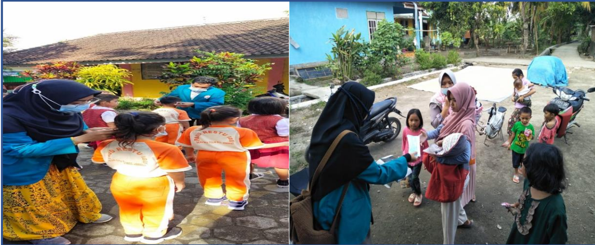
Gambar 2: Pembagian masker dan Pembagian hand sanitizer

hari anak Nasional dan kegiatan lainnya. Selain pembagian masker tersebut mahasiswa juga mensosialisasikan agar tetap menjaga jarak dan tidak berkerumun agar kegiatan berjalan kondusif.