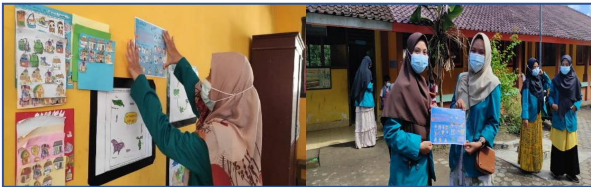
Gambar 1: Penyebaran Pamflet

Mahasiswa KKP-DR UIN Mataram melakukan penyebaran pamflet. Penyebaran pamflet dilakukan untuk mengedukasi masyarakat terkait virus Corona-19. Penyebaran pamflet ini bekerja sama dengan Kepala Desa, dimana penyebaran pamflet dilakukan di beberapa titik yang dianggap strategis dan efektif dijangkau oleh masyarakat. Penyebaran pamflet juga bekerja sama dengan Kepala SDN Batutulis, dimana kami juga menyebar pamflet di SDN Batutulis.