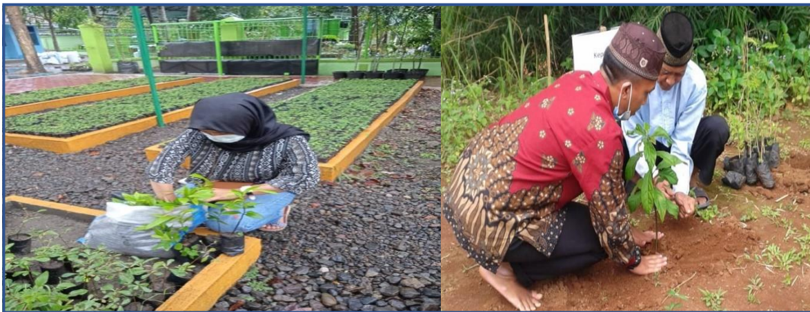
Gambar 10: Penanaman 100 pohon

Mahasiswa beserta masyarakat setempat melakukan gerakan menanam 100 pohon. Sebelumnya kami mengajukan untuk perolehan bibit pohon mahoni di Dinas Lingkungan Hidup dan Kehutanan. Penanaman pohon dilakukan di sepanjang jalan Desa Batutulis. Tujuan penanaman pohon ini agar lingkungan Desa Batutulis menjadi lebih asri serta menjaga udara tetap bersih mengigiat kebiasaan masyarakat yang sering membakar sampah. Dengan adanya penanaman pohon ini bisa meminimalisir adanya polusi udara.