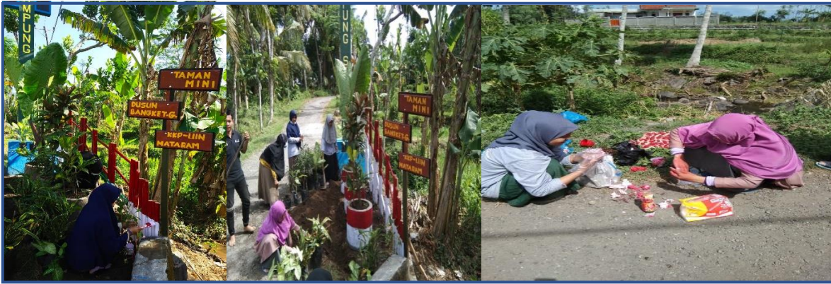
Gambar 9: Pembuatan taman mini