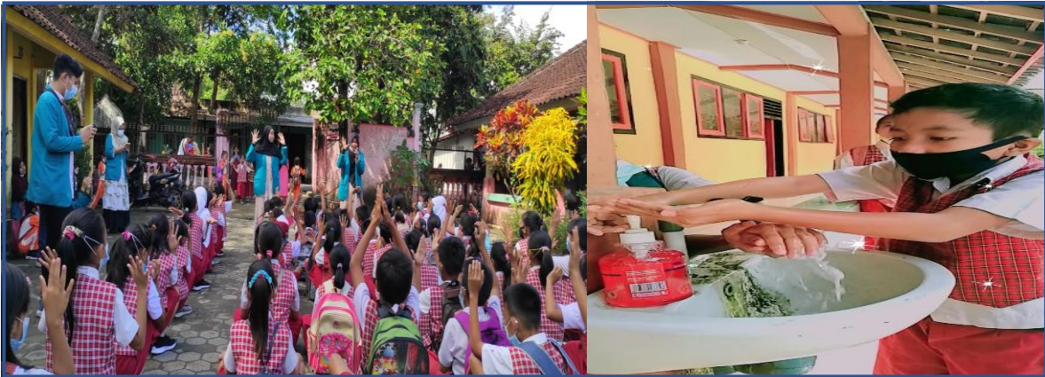
Gambar 4: Sosialisasi cara mencuci tangan yang baik dan benar