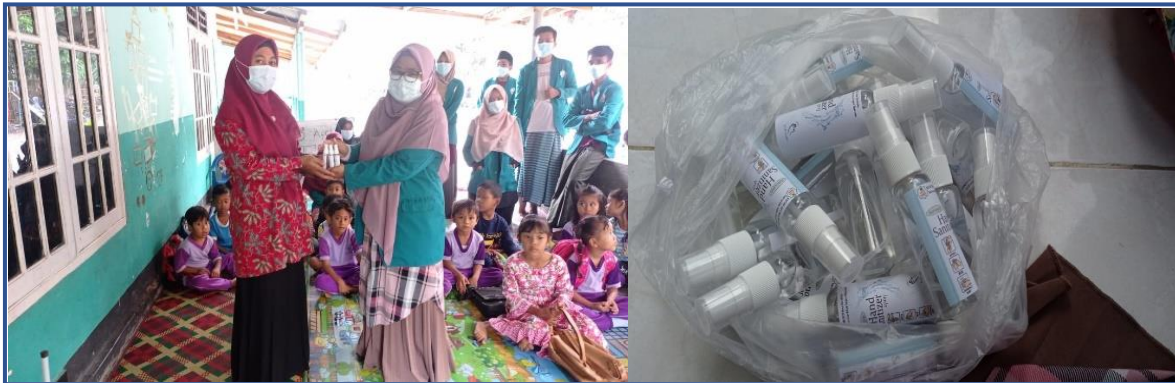
Gambar 3: Pembagian hand sanitizer

Mahasiswa juga melakukan pembagian hand sanitizer di beberapa tempat. Pembagian di lakukan di Paud Al-Hikam, Paud Al-Ansar, di SDN Desa Batutulis, dan MI Sunan Ampel.