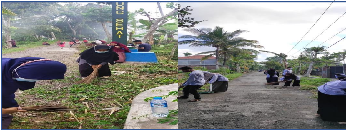
Gambar 6: Gotong royong di sepanjang jalan Dusun Batutulis

Kepala Dusun, dan masyarakat. Kegiatan ini dilakukan dari perbatasan Dusun Jerneng hingga ke Depan Kantor Batutulis.