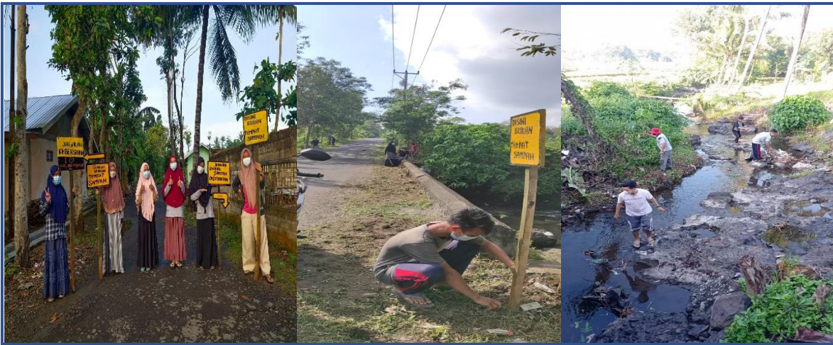
Gambar 8: Pembuatan dan pemasangan plang larangan membuang sampah sembarangan serta pembersihan sungai

Tujuan pembuatan dan pemasangan plang ini agar masyarakat tidak membuang sampah sembarangan, terutama di sungai dan selokan. Hal ini merupakan langkah untuk mewujudkan kampung sehat yang memang merupakan program dari kepala Desa. Masyarakat di Dusun Bangket Gawah masih lalai untuk membuang sampah pada tempatnya. Masyarakat membuang sampah ke sungai terutama sampah non organik seperti popok bayi yang akibatnya berdampak pada musim penghujan. Saat musim penghujan aliran sungai terhambat, air sungai pun meluap dan menyebabkan banjir. Oleh karena itu kegiatan pembuatan plang ini juga dibarengi dengan pembersihan lingkungan serta sungai di bangket gawah dengan mengikutsertakan masyarakat.