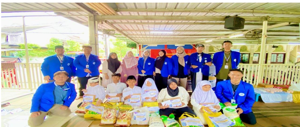
Gambar 5. Penyerahan Santunan Anak Yatim Sekitar TPQ Al Muttaqin dari Para Donatur

d. Santunan Anak Yatim sekitar TPQ Al Muttaqin