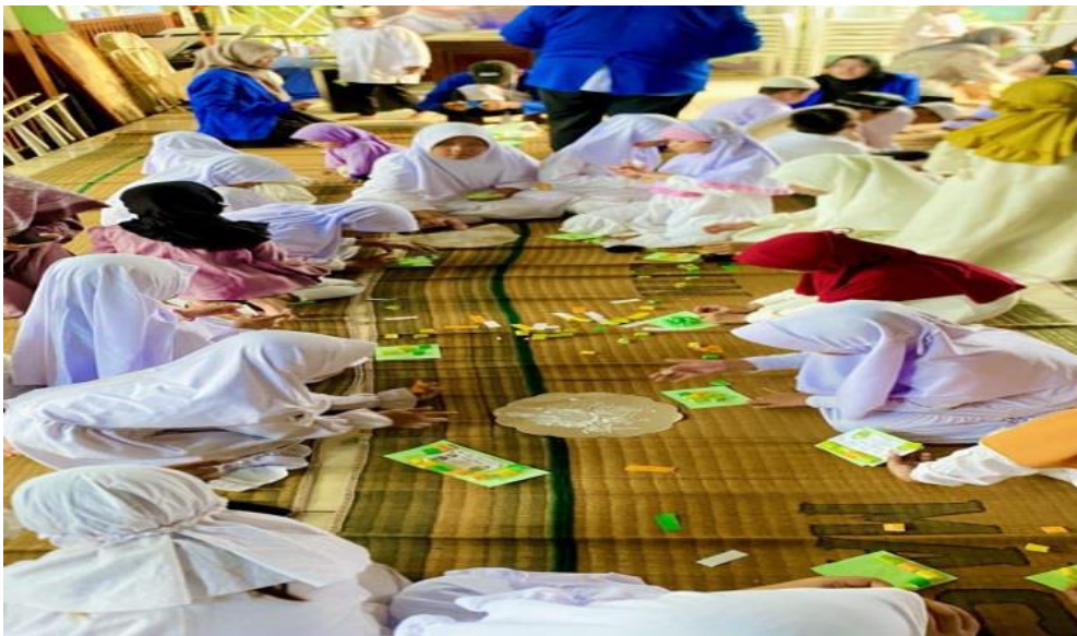
Gambar 4. Pembuatan Kartu Ucapan Marhaban Yaa Ramadhan