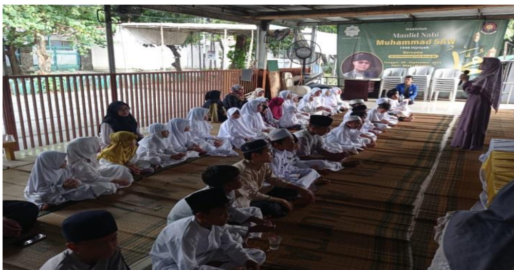
Gambar 2. Implementasi Kegiatan Sholat Berjama'ah Mahasiswa KKN 21 dan TPQ Al Muttaqin