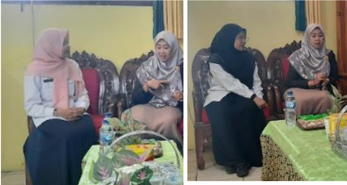
Gambar 2. Define Problem berupa Kegiatan Observasi dan Wawancara dengan Guru SDN Lesanpuro 1

Tahapan kedua adalah tahap mendefinisikan persyaratan. Pada tahap ini dilakukan identifikasi dan pendefinisian kebutuhan untuk implementasi kurikulum merdeka. Pada tahap ini juga sebaiknya telah terumuskan secara jelas untuk pengembangan dan implementasi modul ajar dan media pembelajaran digital. Adapun metode yang digunakan adalah wawancara untuk menemukan dan menentukan kebutuhan dan persyaratan yang spesifik. Selain itu juga digunakan metode observasi untuk melihat sejauh mana modul ajar diterapkan di SDN Lesanpuro 1. Berikut merupakan gambaran dari hasil observasi pembelajaran: