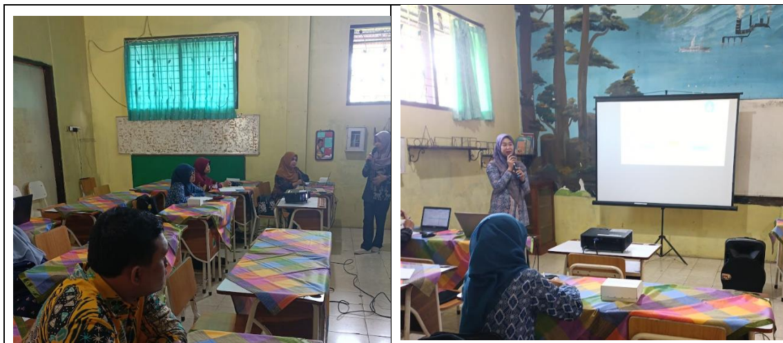
Gambar 4 Foto-Foto saat Intervensi

Tahapan keempat adalah evaluasi. Pada tahapan ini tim mengevaluasi hasil implementasi media pembelajaran berbasis website dan android. Pada tahapan ini juga dilakukan pengumpulan umpan balik dari peserta pelatihan pasca pelatihan. Pemberian umpan balik dilaksanakan dengan peserta mengisi angket respon melalui jamboard. Hasil umpan balik menunjukkan bahwa guru merasa banyak hal baru yang dipelajari, seperti perlunya inovasi pembelajaran yang didasarkan pada masalah. Dijelaskan bahwa permasalahan terkait dengan penggunaan media pembelajaran baik dari nilai rapot pendidikan maupun visi misi sekolah menjadi dasar pengembangan kapasitas guru dalam pemanfaatan media pembelajaran interaktif. Hasil pengisian angket menunjukkan bahwa kepuasan dalam kategori tinggi, dengan skor rata-rata berkisar antara 4.59 hingga 4.85; efektifitas dalam kategori tinggi dengan skor rata-rata berkisar antara 4.59 hingga 4.85. Kepuasan dan efektifitas ini terdiri dari beberapa aspek seperti kebermanfaatan kegiatan, penguasaan pengetahuan, dan implementasi dalam pembelajaran.