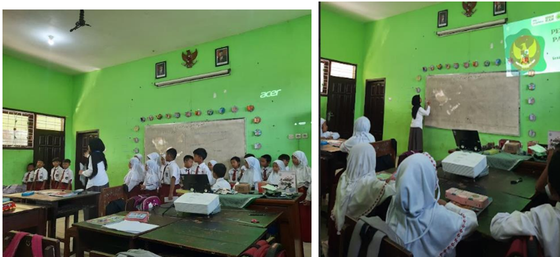
Gambar 3 Foto-Foto saat Observasi Pembelajaran

Hasil observasi pembelajaran menunjukkan bahwa perangkat pembelajaran yang digunakan oleh guru-guru di SDN Lesanpuro 1 sudah sesuai format dan ketentuan berlaku, sarana prasarana memadai seperti adanya fasilitas LCD pada setiap ruang kelas.